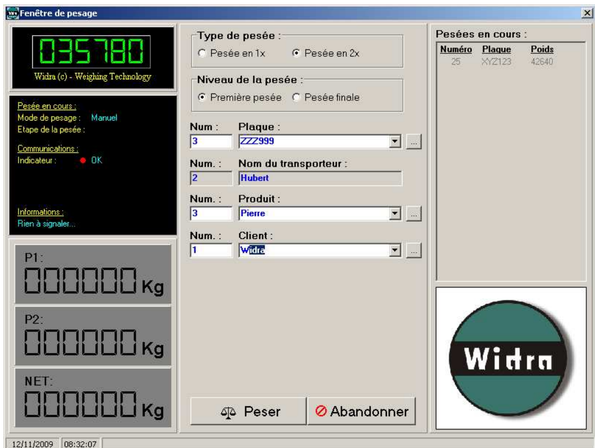
Réalisation d'une pesée d'entrée