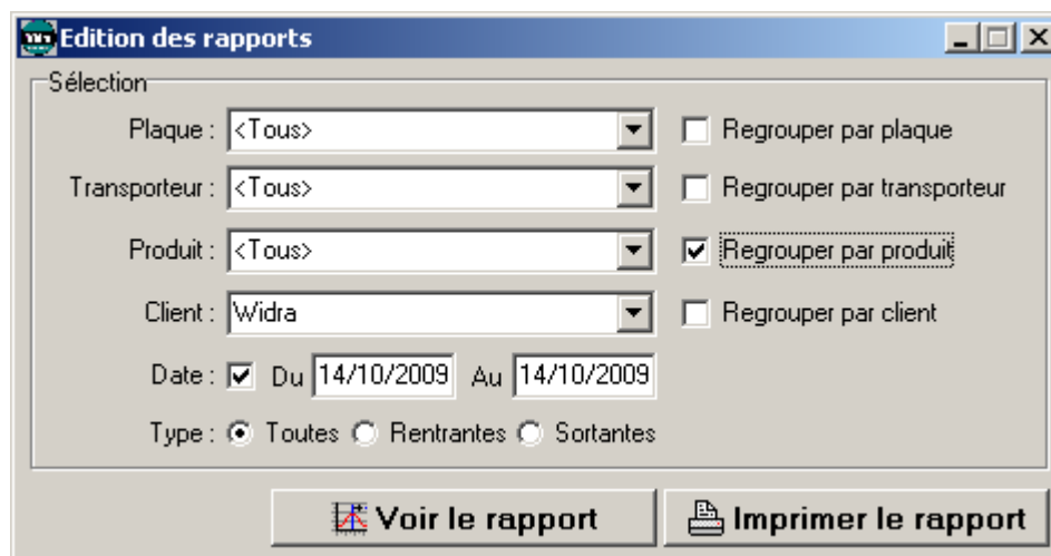
Edition d'un rapport avec sélection et regroupement